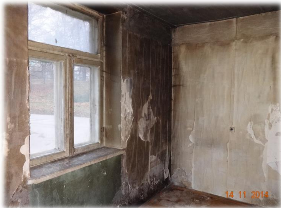
Talsi, Saules iela 9-7

Kopumā dzīvokļi, kuros nepieciešami kapitālieguldījumi, netiekot piedāvāti īrei, vienlaikus tiek apsvērta iespēja tos nodot atsavināšanai.