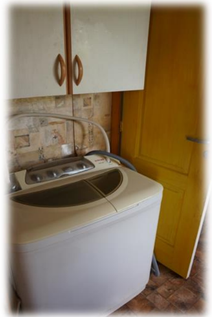
Sigulda, Zinātnes iela 6-41

Siguldas, Rožu ielas 18-7 dzīvoklis šobrīd pašvaldības reģistrā esošajām personām netiek piedāvāts, jo ir remontējams. Istabā ir cauri griesti, maināmi logi. Kā paskaidroja pašvaldības pārstāve, ir apstiprināta cenu aptauja remonta veikšanai. Pirmos paredzēts mainīt dzīvoklī logus. Labierīcības atrodas kāpņutelpā, ūdens ieguves vieta – aka.