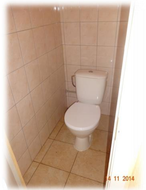
Talsi, Saulstari 7, Mundigciems, Lībagu pagasts