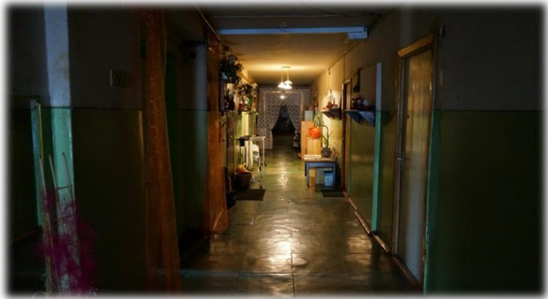
Rīga, Ieriķu iela 2A – gaitenis