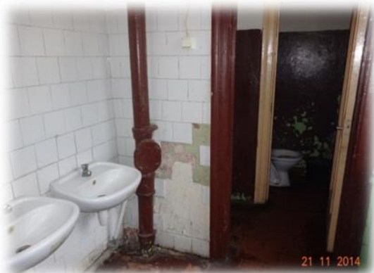
Rūpnīcas iela 6