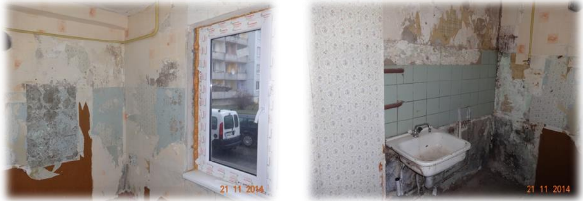
Līvāni, Rīgas iela 4a-31

Līvānos, Rīgas ielā 4a-31 esošajā dzīvoklī jau daļēji ir nomainīti logi un kopumā dzīvoklis ir sagatavots remonta veikšanai.