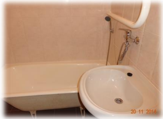
Ogre, Bērzu aleja 8a-13

Savukārt Ogres, Brīvības ielas 113-35 dzīvoklis ir apsekots un tajā ir nolemts veikt remontu, t.sk., jumta remontdarbus.