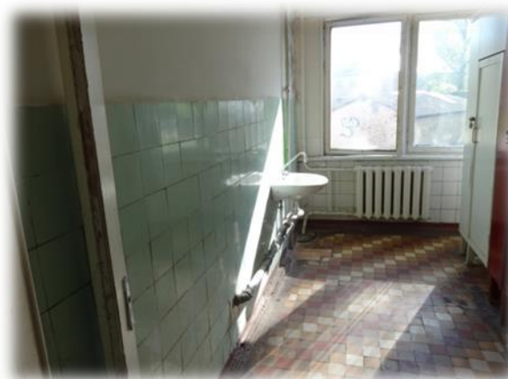
Prūšu iela 25A – koplietošanas labierīcības