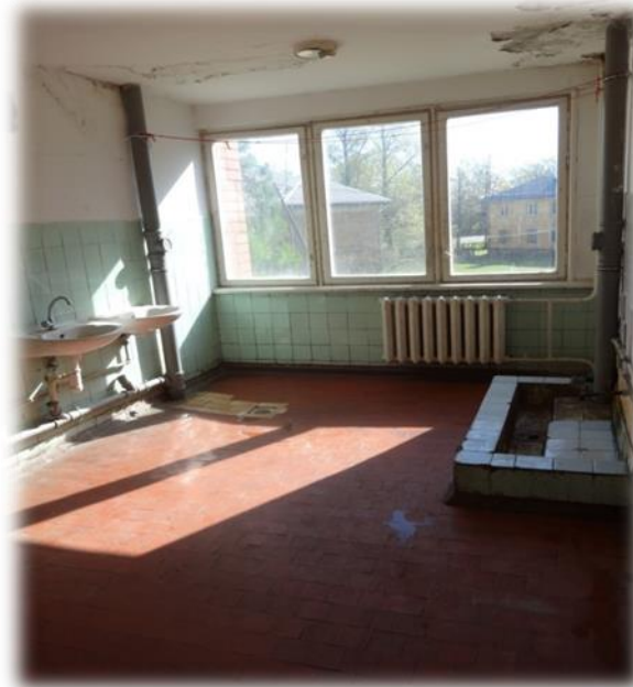
Prūšu iela 25A – koplietošanas dušas telpa (flīžu paaugstinājums bildē pa labi ir duša)