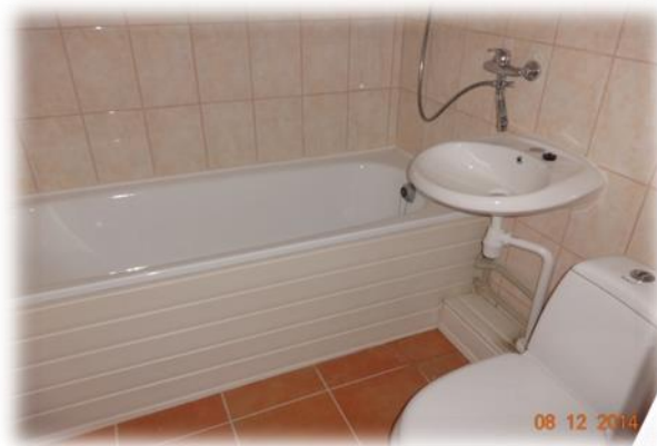
Rīga, Zemes iela 5-57