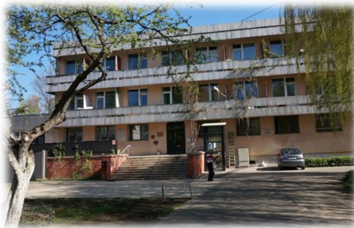
Rīga, Ūnijas iela 49

Mājā tika apsekotas divas dzīvojamās telpas. Koplietošanas virtuve ir viena uz visu stāvu, ko ikdienā lieto aptuveni 22 cilvēki. Savukārt labierīcības un higiēnas telpas tiek dalītas uz divām istabām.