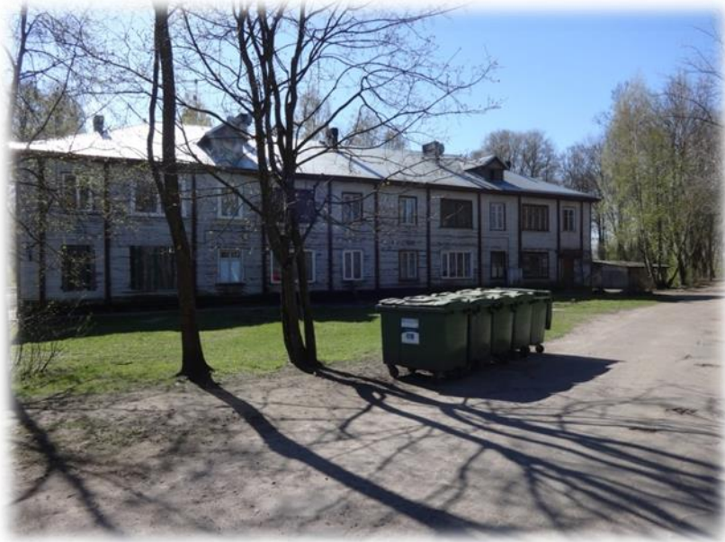
Rīga, Mangaļsalas iela 21

12 no tiem ir brīvi, bet 10 dzīvokļi ir apdzīvoti, vairāki apvienoti. Vairāki neapdzīvotie dzīvokļi pēc to vairākkārtējas uzlaušanas ir aiznagloti.