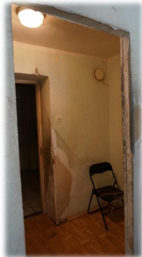
Rīga, Ieriķu iela 2B – brīvā dzīvojamā telpa Nr.219