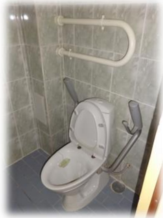
Jūrmala, Nometņu iela 2a-118

Dzīvoklī Jūrmalā, Skolas ielā 63-24 arī tikko veikts remonts. Dzīvoklis aprīkots arī ar jaunu santehniku.