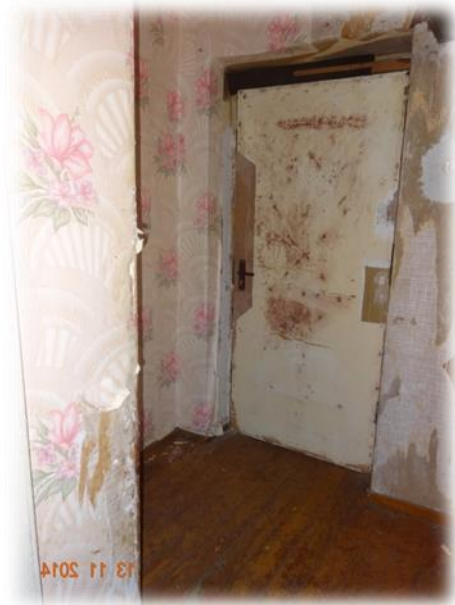
Dobeles novads, Gardene, Priežu iela 28-20