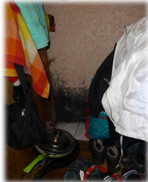
Prūšu iela 25A – pelējuma sēnīte kādā no istabām

Savukārt attiecībā par nama Rīgas, Mangaļsalas ielas 21 apsekošanu tika lemts, jo Tiesībsarga birojā bija vērsusies persona (kā bez vecākiem palicis bērns bārenis), kura norādīja uz pašvaldības rīcību, atsakot viņu reģistrēt palīdzības reģistrā mājokļa jautājumu risināšanā, jo viņa neatbilst tām personu kategorijām, kurām palīdzība sniedzama, proti, viņa nav zaudējusi dzīvojamās telpas Mangaļsalas ielā 21 - ( dzīvokļa numurs dzēsts ), Rīgā lietošanas tiesības un var tur atgriezties dzīvot. Zīmīgi, ka atteikums personu reģistrēt pieņemts 21.03.2012., bet Rīgas dome 14.08.2012. pieņēma lēmumu Nr.5065 par mājā esošo īrnieku izvietošanu uz citām dzīvojamām telpām, atzīstot, ka tehniskā stāvokļa dēļ, māja nav derīga pastāvīgai dzīvošanai. Ēkai nefunkcionē kanalizācijas sistēma, nav iespējams nodrošināt apkuri. Īrniekiem, kas līdz šim maksājuši īri un norēķinājušies par saņemtajiem komunālajiem pakalpojumiem, piedāvās īrēt citas dzīvojamās telpas. Pēc iedzīvotāju izvietošanas tiks pieņemts lēmums par šīs dzīvojamās mājas turpmāko izmantošanu. 3