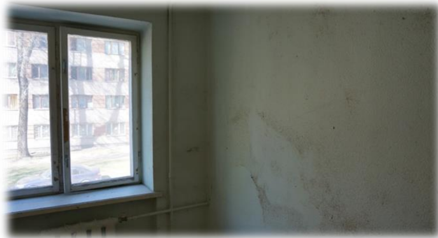
Rīga, Ieriķu iela 2B – brīvā dzīvojamā telpa Nr.219