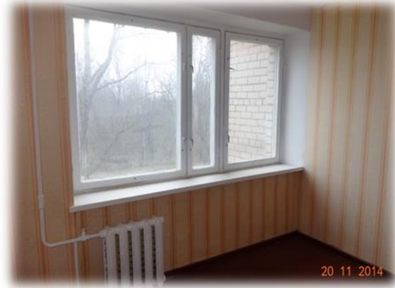
Aizkraukle, Lāčplēša iela 12-33

Par dzīvokļa Aizkrauklē, Lāčplēša ielā 12-33 izīrēšanu ir saņemta personas piekrišana.