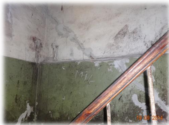
Rīga, Alauksta iela 17