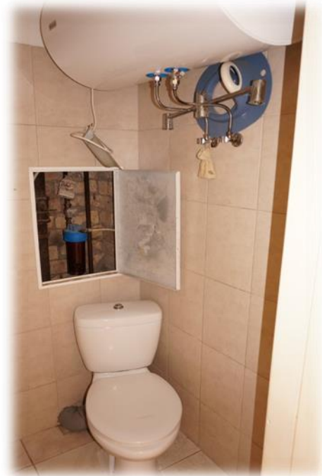
Ādaži, Gaujas iela 25k-1/23