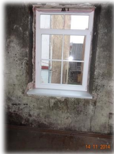
Kandava, Lielā iela26-3

Arī Kandavas pašvaldības pārstāvis norādīja, ka pašvaldībai ir problēmas ar tiem īrniekiem, kuri neveic ne maksājumus par dzīvojamo telpu īri un saņemtajiem komunālajiem pakalpojumiem, ne arī kārtējo remontu, tādējādi kopumā bojājot dzīvojamo fondu, kas pēc tam par pašvaldības līdzekļiem jāremontē.