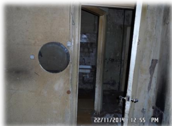
Rīga, Pērnavas iela 37-22

Tādējādi secināms, ka speciālisti ir atzinuši Rīgas, Pērnavas ielas 37-22 dzīvojamās telpas par dzīvošanai derīgām, kam nepiekrīt ne potenciālie īrnieki, kuriem šis dzīvoklis tiek rādīts, ne arī Tiesībsarga birojs.