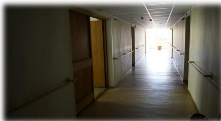
Rīga, Ūnijas iela 49 gaitenis

Mājā tika apsekotas divas dzīvojamās telpas. Koplietošanas virtuve ir viena uz visu stāvu, ko ikdienā lieto aptuveni 22 cilvēki. Savukārt labierīcības un higiēnas telpas tiek dalītas uz divām istabām.