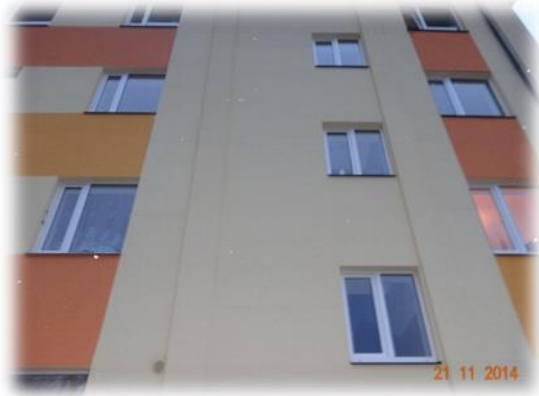
Madonas novads, Kalsnavas pagasts, Rūpnīcas iela 1-5

Madonas novadā, Kalsnavas pagastā, Vesetas ielā 10-11 esošais dzīvoklis atrodas bijušās spirta rūpnīcas mājā. Dzīvoklim nav vannasistabas un tas ir vienīgais vienistabas dzīvoklis ēkā. Kā pluss minēta mājas lētā apkure.