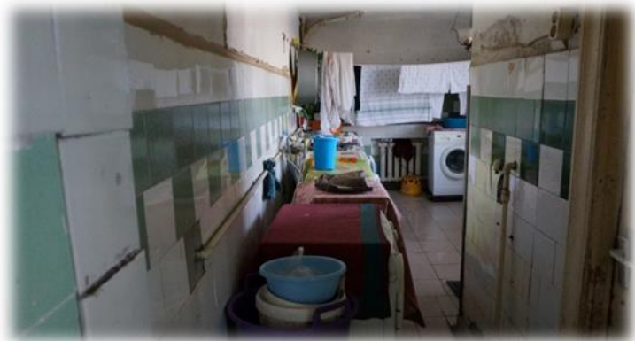
Rīga, Ieriķu iela 2A – veļas telpa

Rīgas, Ūnijas ielas 49 nams ir sociālā dzīvojamā māja, kura telpās arī atrodas nodibinājums „Latvijas Evaņģēliski luteriskās Baznīcas Diakonijas centrs” un tā izveidotais Dienas centrs, lai palīdzētu bērniem un pieaugušajiem no sociālā riska ģimenēm.