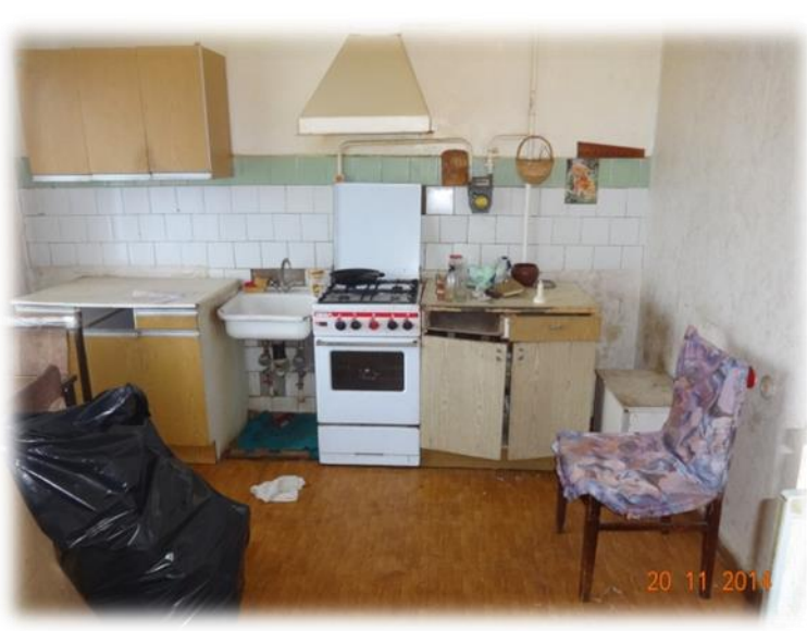
Ogre, Brīvības iela 113-35