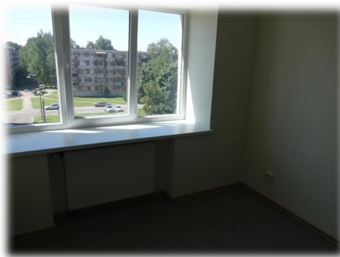
Jūrmala, Skolas iela 44-128

Kopumā mājas gaiteni ir tīri, gaiši un sakopti, protams, atkal jāpiebilst, ka viss ir atkarīgs no cilvēku kultūras līmeņa un pašu vēlmes dzīvot sakoptā vidē. Minētais attiecas uz jau sazimētām kāpņutelpas sienām un tajās ar cigarešu izsmēķiem izdedzinātiem caurumiem.