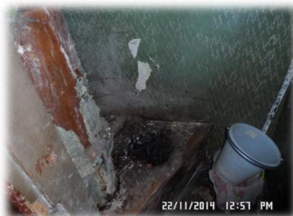
Rīga, Pērnavas iela 37-22 (labierīcības)