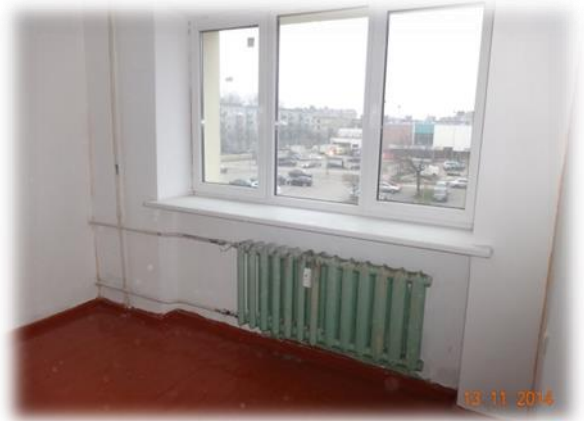
Jelgava, Raiņa iela 10-38