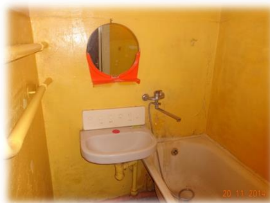
Jēkabpils, Viesītes iela 49-54