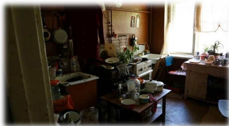
Rīga, Zaļenieku iela 40-21