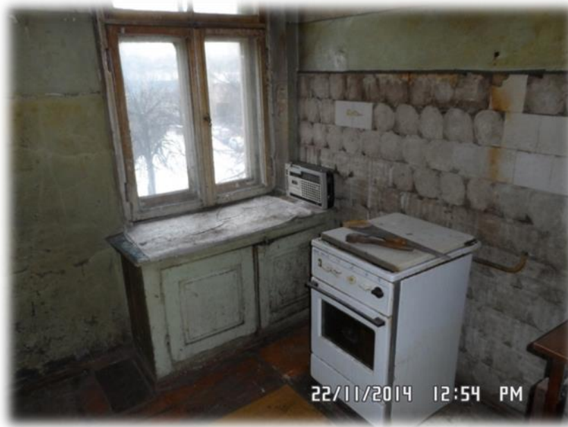
Rīga, Pērnavas iela 37-22 (virtuve)

Jāatzīst, ka Rīga ir viena no retajām pašvaldībām, kurā notiek arī jaunu dzīvojamo māju celtniecība. Rīgā tika apsekoti arī dzīvokļi pēc tikko veikta remonta un tas tomēr liecina par pašvaldības iespējām remontēt dzīvojamās telpas un uzturēt tās tādā stāvoklī, lai jaunais īrnieks nešaubītos par to atbilstību dzīvošanai derīgas telpas kritērijiem. Tā piemēram, Rīga, Zemes iela 5-57 – silts, tīrs un gaišs. Konkrētais dzīvoklis šobrīd ir jau izīrēts.