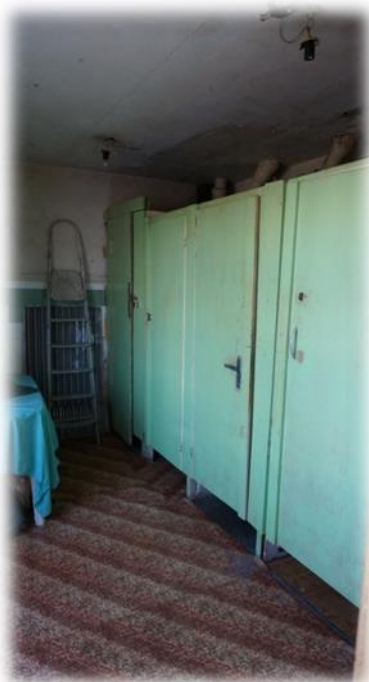
Rīga, Ieriķu iela 2A – labierīcības