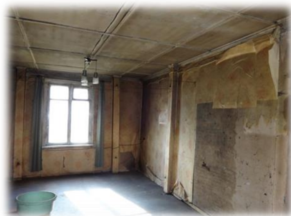
Rīga, Mangaļsalas iela 21 – dzīvojamā telpa

2015.gada 24.februārī Tiesībsarga birojā vērsās persona, kura ir Rīgas, Mangaļsalas ielas 21 nama dzīvokļa īrnieks, norādot, ka mājā nestrādā kanalizācijas sistēma, tāpat dzīvojamā telpā ir sagrūvusi krāsns, kas liedz gan telpu apsildīt, gan pagatavot ēdienu, bet ne mājas apsaimniekotājs, ne Rīgas domes Apsaimniekošanas pārvalde šo problēmu risināt nevēlas, jo ēkas ekspluatāciju ir nolēmts pārtraukt, tādējādi ieguldīt papildus finanšu līdzekļus remontam neesot lietderīgi. Kā konsultācijas laikā norādīja dzīvojamās telpas īrnieks, ar viņa pensiju pietiek vien iztikai un daļējai medikamentu izdevumu segšanai, tāpēc paša spēkiem iegādāties jaunu santehniku (klozetpodu) nav iespējams.