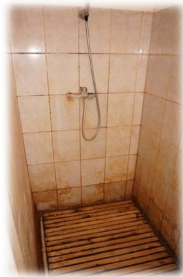
Stopiņi, Cekules iela 8 – labierīcības, duša

Sanitārā mezgla telpās jūtams liels mitrums, lai gan ventilācijas sistēma strādā.