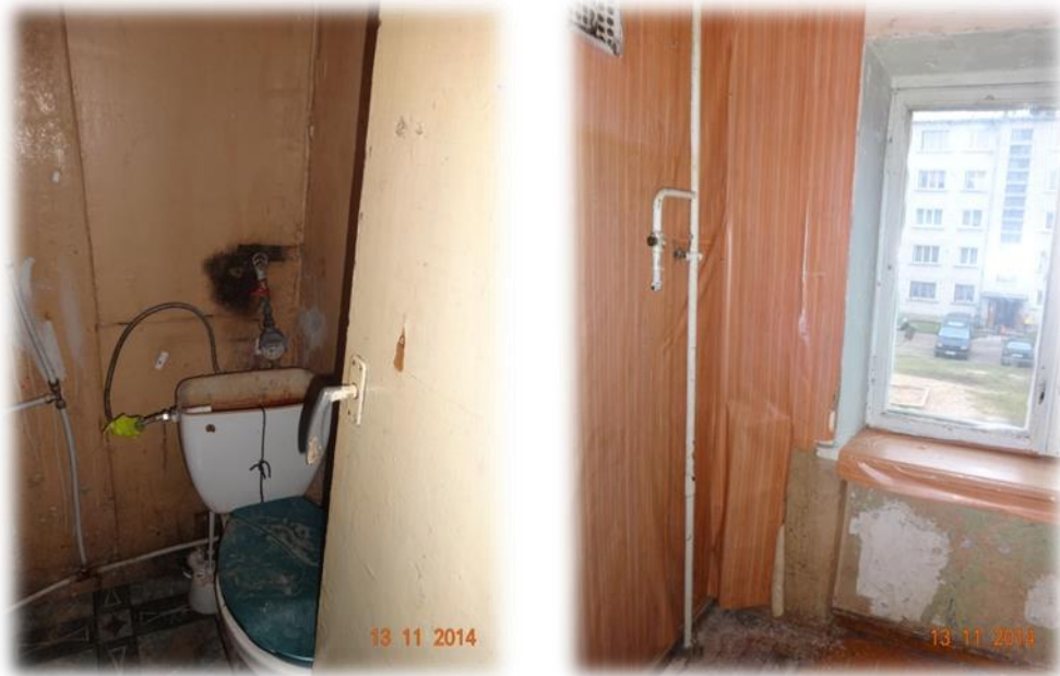
Dobeles novads, Gardene, Priežu iela 28-20