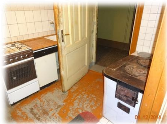
Rīga, Ģertrūdes iela 135-13

Brīvā dzīvojamā telpa Rīgā, Krāsotāju iela 15-37 uz apsekošanas brīdi aptuveni divus gadus ir brīva no ģimeļiem, bet dzīvoklī atrodas iepriekšējā ģimeļa mēbeles un mantas. Dzīvoklis izvietots divstāvu koka mājas otrajā stāvā, kurā atsevišķi dzīvokļi ir privatizēti, līdz ar ko ir apgrūtināta kopīpašuma pārvaldīšana. Piemēram, apsekotais brīvais dzīvoklis un blakus esošajā mītošie ģimeļnieki izmanto vienas labierīcības, kas netiek uzturētas pienācīgā kārtībā, jo puses nespēj vienoties par noteiktiem kārtības kritērijiem. Tāpat blakus dzīvokļa ģimeļniece norādīja, ka vannasistabā veikta nelikumīga būvniecība, kas arī nav pabeigta.