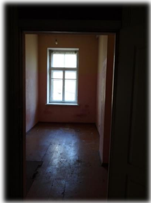
Rīga, Mangaļsalas iela 7B- brīvā dzīvojamā telpa

Ēka ir bijušās kazarmas, kur garā gaitenī izvietoti dzīvokļi. Labierīcības un higiēnas telpas, kas atrodas gaitenī, ir antisanitārā stāvoklī.