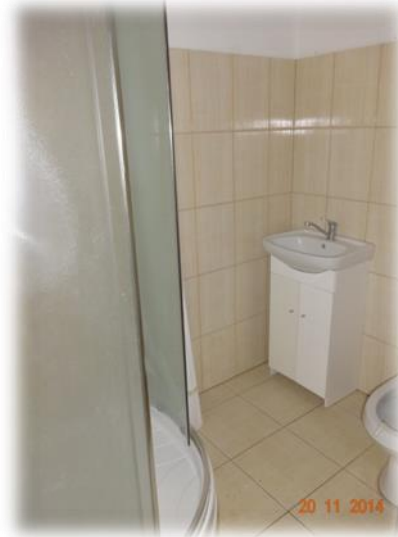
Ikšķiles, Dainu ielas 1-29

Ikšķiles novads, Tīnūžu pagasts, Ceplīši, Priežu iela 3-5 – dzīvojamās telpās atrodas ļoti daudz iepriekšējā īrnieka mantas (trauki, gultas veļa). Dzīvoklim šobrīd ir centrālā apkure, bet nākotnē tiek plānots ierīkot krāsns apkuri.