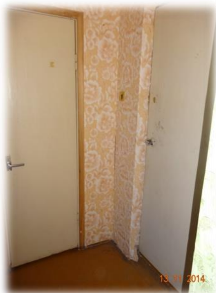
Skrunda, Pumpuri 26, Skrundas pagasts

Kopumā Skrundā ir renovētas divas mājas. Pašvaldības pārstāvji arī norādīja, ja dzīvoklim ir nepieciešami kapitālieguldījumi, bet persona to vēlas īrēt, pašvaldība izskata iespēju šo dzīvojamo telpu remontēt pēc īres līguma noslēgšanas.