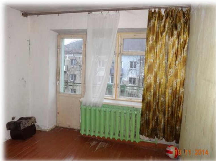
Liepāja, Turaidas iela 14-16