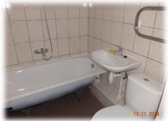
Liepāja, Vānes iela 11-22