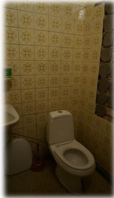
Rīga, Ūnijas iela 49, istabas Nr.33 koplietošanas higiēnas telpas