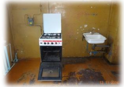
Skrunda, Sporta iela 1a-5