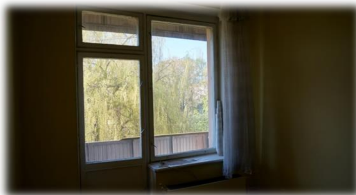
Rīga, Ūnijas iela 49, istaba Nr.33

Kopumā secināms, ka koplietošanas telpas (virtuve, gaitenis) ir tīras un kārtīgas. Brīvo dzīvojamo telpu stāvoklis visbiežāk ir atkarīgs no tur iepriekš dzīvojošās personas kultūras līmeņa un attieksmes pret cita mantu.