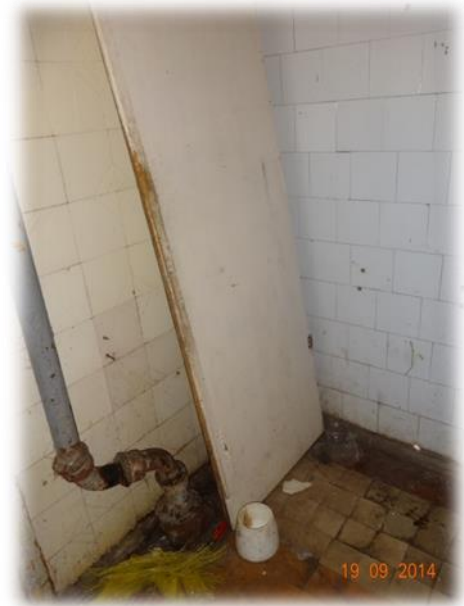
Rīga, Valmieras iela 24 koplietošanas labierīcības un dušas telpa

Rīga, Ģertrūdes iela 135-13 dzīvoklis ir ar daļējām ērtībām, kas atrodas Rīgas centrā. Koplietošanas labierīcības ir labā stāvoklī, tīras.