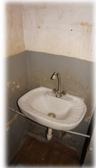
Cēsis, Saules iela 23 - 319

2007.gadā celtajā namā Cēsis, Caunas ielā 7a pārsvarā dzīvo denacionalizēto namu īrnieki, kuri saņēmuši pašvaldības palīdzību mājokļa jautājuma risināšanā. Māja tīra un kārtīga. Aplūkotā dzīvojamā telpa Nr.5 piemērota arī personai ar invaliditāti.