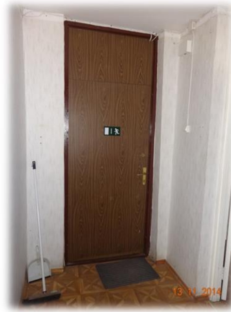
Dobele, Bērzes iela 15-30

Dobeles, Bērzes ielas 21 dzīvoklis Nr.17 tiek piedāvāts īrēšanai tādā stāvoklī, kādā tas ir uz Tiesībsarga biroja monitoringa laiku. Pašvaldības pārstāvji norāda, ka pašvaldības reģistrā esošās personas bieži vien izsakot vēlmi pašas kosmētiski remontēt izīrēto dzīvojamo telpu. Līdz ar to arī šajā dzīvoklī remontdarbi no pašvaldības puses netiek plānoti.