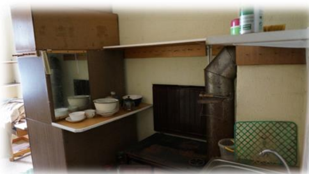
Rīga, Krāsotāju iela 15-37

Rīgas, Mores ielas 7-44 bija dzīvojamā telpa, kura tika apsekota kā pirmā, jo par šo konkrēto pašvaldībai piederošo dzīvojamo telpu tika saņemta sūdzība,