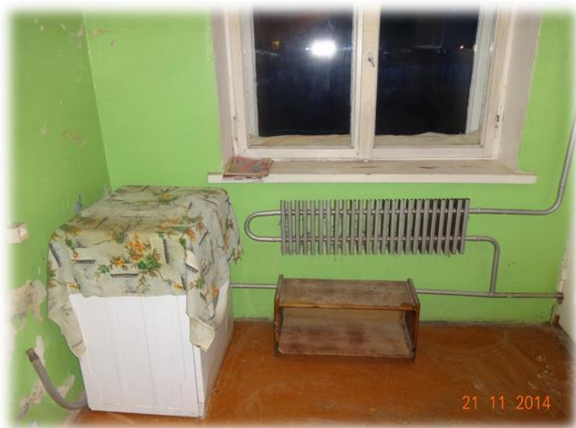
Madonas novads, Kalsnavas pagasts, Vesetas iela 10-11