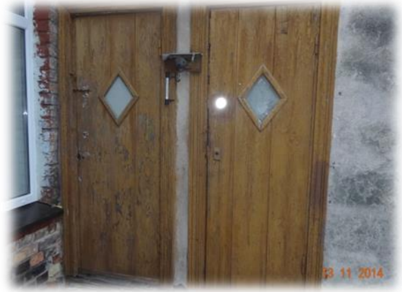
Jelgava, Pētera iela 21-1

Dzīvoklī ir malkas apkure, sētā atrodas malkas šķūnis, kura renovāciju finansējusi pašvaldība.