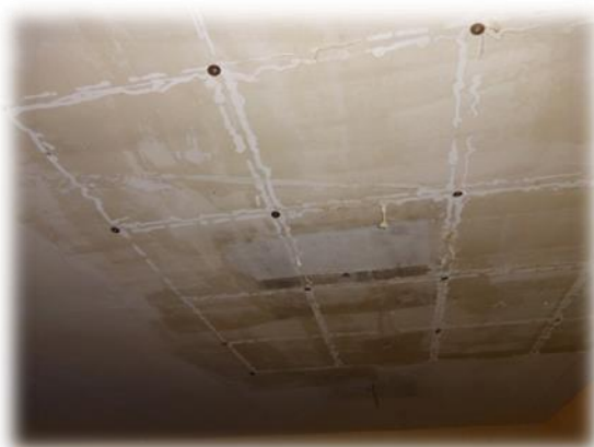
Rīga, Prūšu iela 25A – istabas griesti