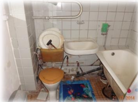
Līvāni, Lāčplēša iela 23-33