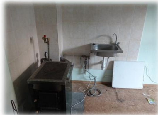
Rīga, Alauksta iela 17-10

Jāatzīmē, ka mājas sienā ir redzamas iespaidīgas plaisas, kas rada bažas par mājas kopējo tehnisko stāvokli. Apsaimniekotāja pārstāvis gan norādīja, ka mājas tehniskā stāvokļa uzlabošanai ir izstrādāts projekts, kas ietver arī ēkas sienās esošo plaisu novēršanu.