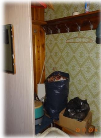
Ikšķiles novads, Tīnūžu pagasts, Ceplīši, Priežu iela 3-5