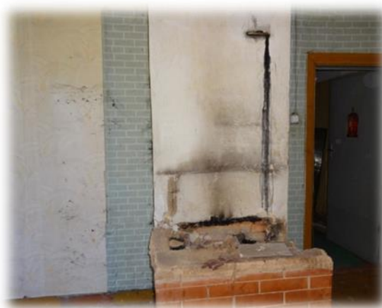
Dzīvojamās telpas apsildes/ēdiena gatavošanas krāsns

Ārpus pieteiktajām apskatāmajām dzīvojamām telpām, teritorijas pārzinis Tiesībsarga biroja pārstāvjiem parādīja dzīvojamo telpu ēkā Rīgā, Mangaļsalas ielā 7b , kas nesen atbrīvojusies un nodota pašvaldības izlemšanai par tās tālāko ekspluatāciju.