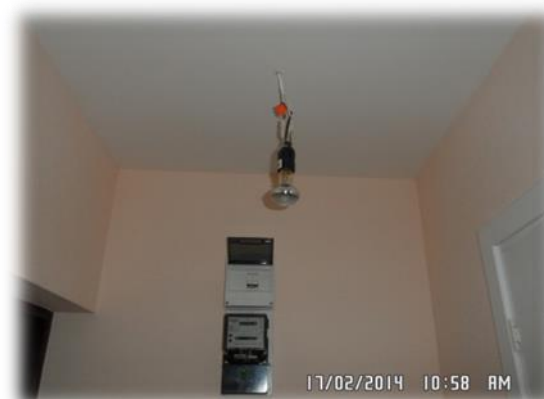
Rīga, J.Asara iela 16-11

Kapitālais remonts veikts arī Rīgā, Alauksta ielā 21-1.