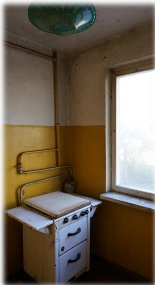
Rīga, Mores iela 7-44