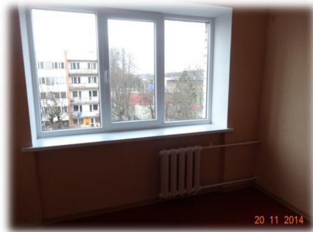
Ogre, Skolas iela 16-61

Ogres pašvaldības pārstāvji brīvās dzīvojamās telpas sākotnēji apseko, sastāda tāmi par nepieciešamajiem remontdarbiem, pēc kā secīgi tiek lemts par remonta nepieciešamību. Personām dzīvojamās telpas pārsvarā tiek piedāvātas pēc šādas kārtības ievērošanas. Pašvaldībā apskatītas trīs brīvās pašvaldībai piederošās dzīvojamās telpas. Ogre, Skolas iela 16-62