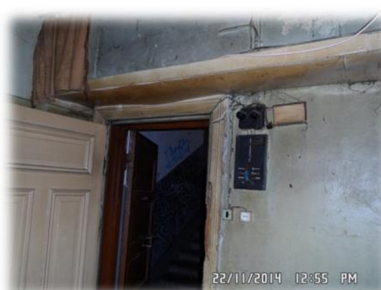
Rīga, Pērnavas iela 37-22 (priekštelpa)