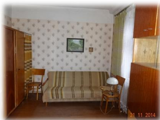
Varaklāni, Pils iela 44-4