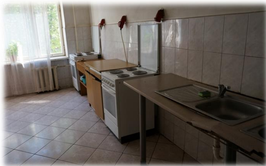
Rīga, Ieriķu iela 2B – koplietošanas virtuve

Ieriķu ielā 2A Tiesībsarga biroja pārstāvjiem tika uzrādītas kopējā lietošanā esošās telpas, kas ievērojami atšķirās no blakus esošās Ieriķu ielas 2B, kurā 2001.gadā tika veikts kapitālais remonts, tomēr ēkai ir acīmredzamas problēmas ar ventilāciju, kā rezultātā, pārmērīga mitruma ietekmē, vairākās koplietošanas telpās dažādos ēkas stāvos ir pelējuma sēnīte, kas negatīvi ietekmē ēkā dzīvojošo personu veselību. Jāatzīmē, ka sēnīšu flora ir arī viens no gaisa piesārņotājiem. Tā piemēram, Tiesībsarga birojā 2013.gada nogalē vērsās Rīgas, Ieriķu ielas 2B īrniece, kura norādīja uz radušajām veselības problēmām pelējuma sēnītes dēļ.