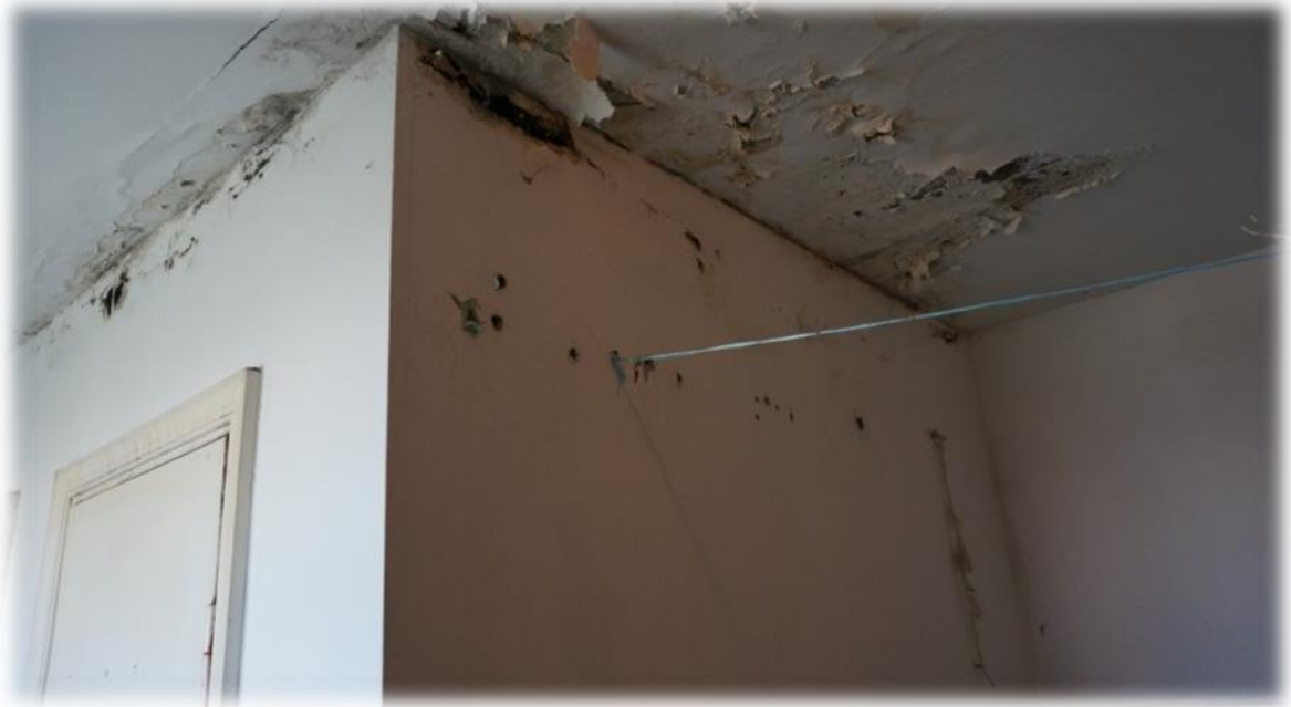
Rīga, Ieriķu iela 2B – dušas telpas griesti