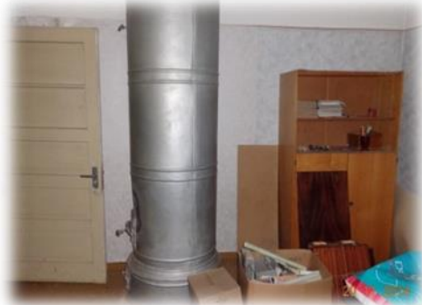
Jēkabpils novads, Bērzgales skola