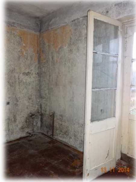
Dobele, Bērzes iela 21-17

Iepriekšējie īrnieki no dzīvokļa paņēmuši visu, t.sk, arī klozetpodu, kas nākamajam īrniekam visticamāk jāgādā pašam.