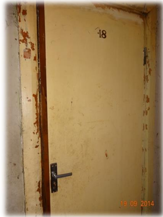
Rīga, Valmieras iela 24-18

Ētisku apsvērumu dēļ ziņojumā netiek uzrādītas atsevišķas koplietošanas labierīcību bildes.