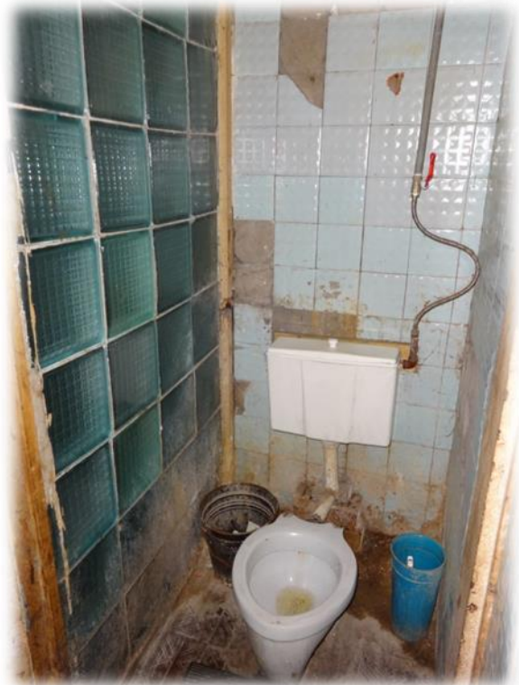
Rīga, Mangaļsalas iela 21 – labierīcības