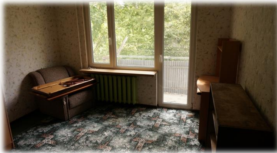
Ādaži, Kadaga 5-20

Ādažu, Gaujas ielas 25k-1/23 dzīvokli ir paredzēts piešķirt bērnam bārenim, kurš drīzumā kļūs pilngadīgs un viņam beigsies ārpusģimenes aprūpe.