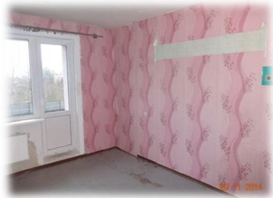
Jēkabpils pilsēta, Krustpils, Slimnīcas iela 4-8

Viens no visbiežāk minētajiem personu atteikuma iemesliem dzīvot Krustpils pusē, ir šeit atklātā tipa cietuma izveide, līdz ar ko iedzīvotāji baidās par savu drošību. Pašvaldības pārstāvji norādīja, ka pašvaldībai piederošos dzīvokļus viņi nevarot atsavināt (izsole), jo ir dzīvokļu rindas ar tajās esošām personām. Šajā gadījumā jānorāda, ka pašvaldībai ir tiesības atsavināt sev piederošu nekustamo īpašumu saskaņā ar Publiskas personas mantas atsavināšanas likumu, turklāt šādu praksi piekopj vairākas citas pašvaldības.