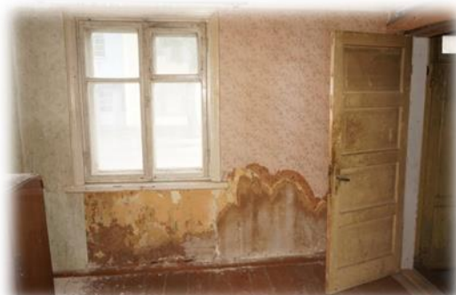
Cēsis, Rīgas iela 42-1

Tiesībsarga ieskatā šādā stāvoklī dzīvojamās telpas īrniekiem nav piedāvājamas, jo tās neatbilst dzīvošanai derīgas telpas nosacījumiem. Gadījumā, ja pašvaldībai nav līdzekļu telpu remontam, kas šajā gadījumā visticamāk būtu kapitālais remonts, tai jāapsver iespēja atsavināt dzīvojamās telpas, kuras pēc būtības ilgtermiņā pašvaldībai rada zaudējumus.