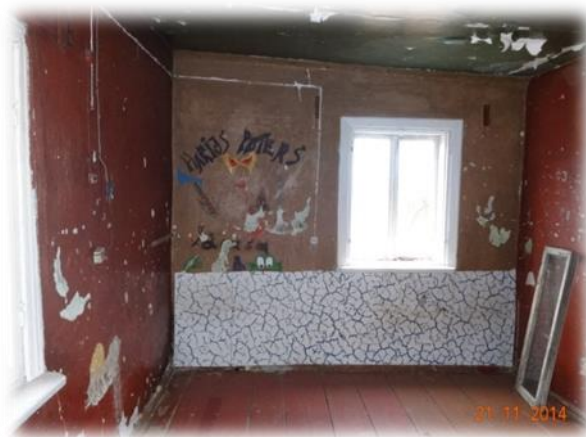
Varakļāni, Kapsētas 12