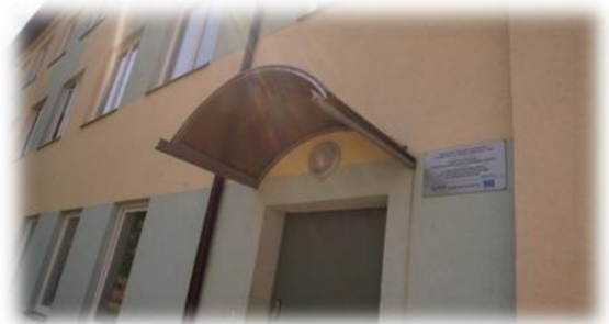
Cēsis, Caunas iela 8