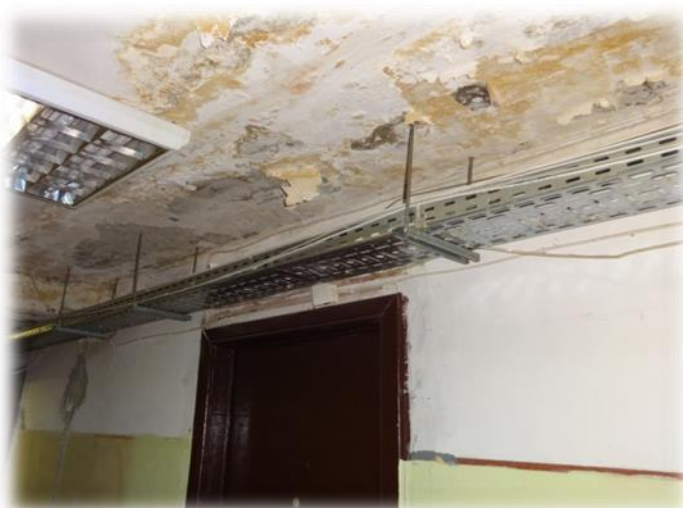
Prūšu iela 25A – griesti gaitenī