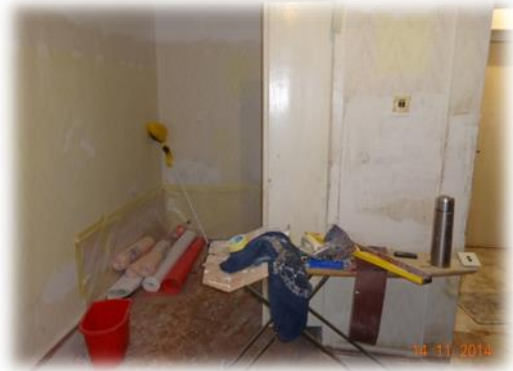
Kandava, Ozolu iela 7-26

Dzīvokli Kandavā, Lielā ielā 26-3 šobrīd īrēt personām nepiedāvā, jo tas tikšot remontēts.