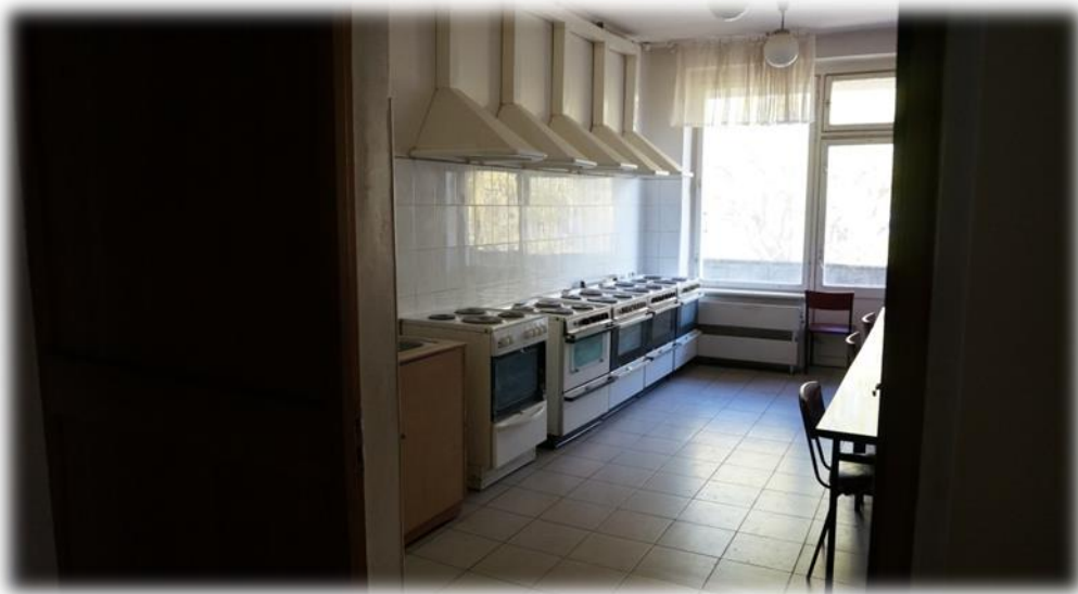
Rīga, Ūnijas iela 49 koplietošanas virtuve

Kā norādīja mājas kontaktpersona, pāris dienas atpakaļ Ūnijas ielas 49 namā atbrīvojusies istaba Nr.25, un šobrīd Rīgas domes atbildīgā komisija lemjot par remonta nepieciešamību. Jāatzīmē, ka apskates laikā telpā bija nepatīkami uzturēties tajā esošās smakas un prusaku dēļ. Jau pirmsšķietami secināms, ka šeit ir nepieciešams remonts, lai tā atbilstu cilvēka ilglaicīga patvēruma kritērijiem.