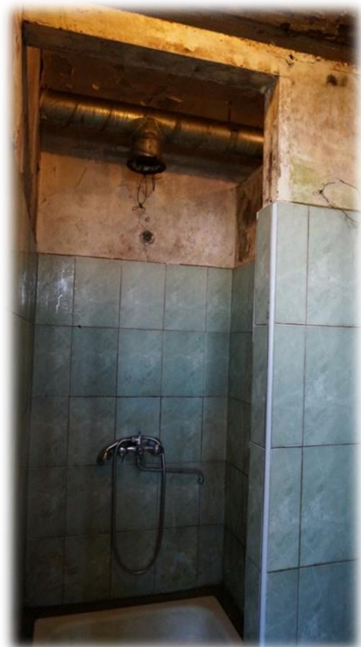
Rīga, Ieriķu iela 2B – dušas telpa