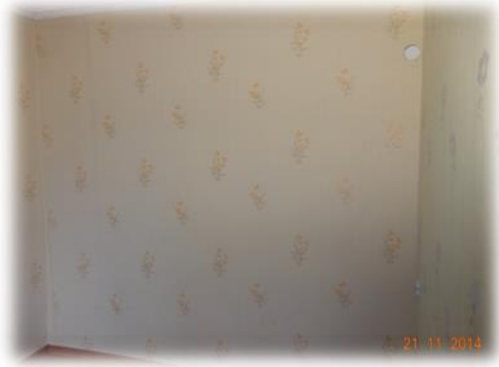
Daugavpils, Šaurā iela 25-27

Apsekotajā dzīvoklī Daugavpilī, Šaurā ielā 25-27 veikts kosmētiskais remonts.