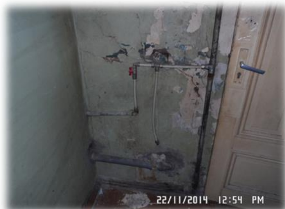
Rīga, Pērnavas iela 37-22 (aukstā ūdens stāvvads)