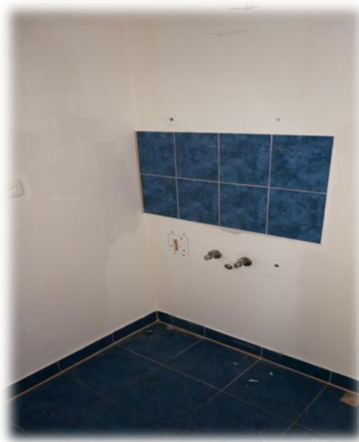
Siguldas novads, Plānupe, Augšupes 1, Allažu pagasts