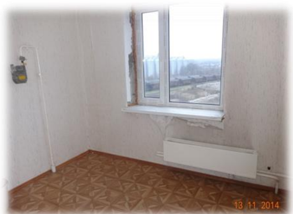
Dobele, Bērzes iela 15-30