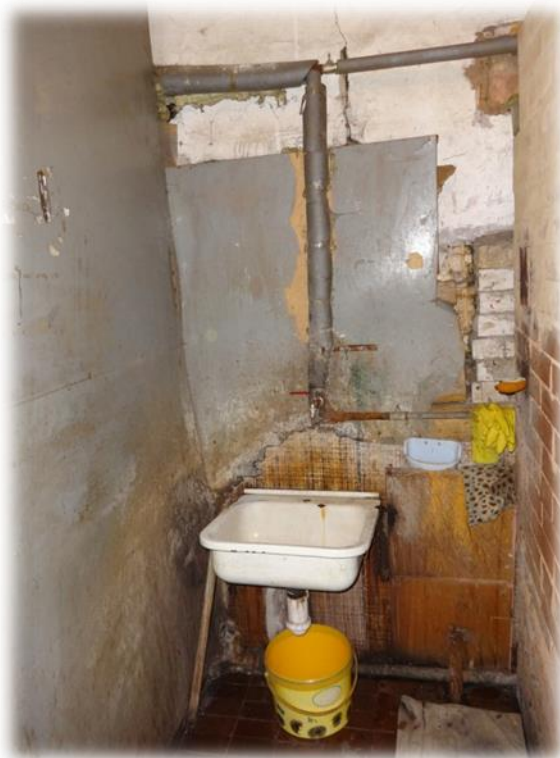
Rīga, Mangaļsalas iela 21 – mazgāšanās telpa

Labierīcības un nosacīti higiēnas telpas, t.i., atsevišķi nodalītas telpas, atrodas ēkas 1.stāvā, kur ir viena izlietne un trīs kabīnes, kur jābūt klozetpodiem, bet izmantojams ir tikai viens. Divas kabīnes aizslēgtas. Dušas vai vannas nav. Lai nomazgātos, mājas iedzīvotāji izmanto vienu izlietni (skat. mazgāšanās telpa).