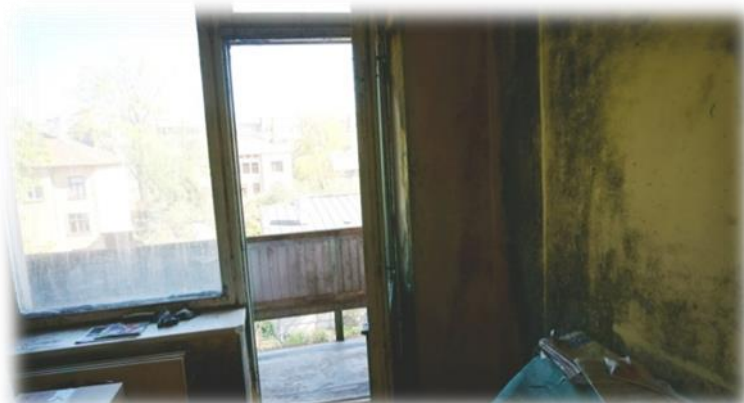
Rīga, Ūnijas iela 49, istaba Nr.25

Rīgas, Alauksta ielas 17 nama brīvā dzīvojamā telpa Nr.10 ir labā stāvoklī, lai gan koplietošanas labierīcībās ir antisanitāri apstākļi. Šādā situācijā īrniekam būtu jāizvērtē alternatīvs labierīcību ierīkošanas veids.