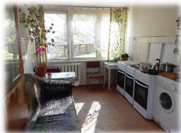
Prūšu iela 25A – koplietošanas telpa (virtuve)