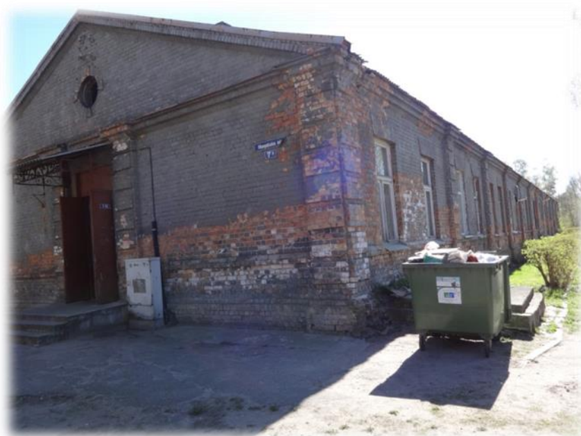
Rīga, Mangaļsalas iela 7B

Ārpus pieteiktajām apskatāmajām dzīvojamām telpām, teritorijas pārzinis Tiesībsarga biroja pārstāvjiem parādīja dzīvojamo telpu ēkā Rīgā, Mangaļsalas ielā 7b , kas nesen atbrīvojusies un nodota pašvaldības izlemšanai par tās tālāko ekspluatāciju.