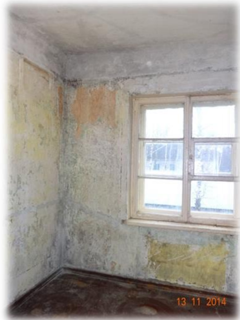
Dobele, Bērzes iela 21-17