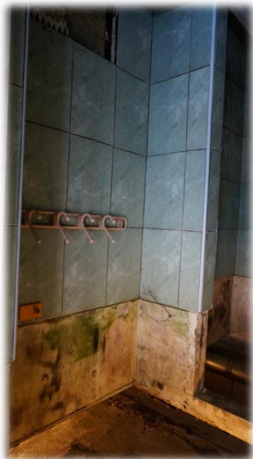
Rīga, Ieriķu iela 2B – dušas telpa

Savukārt Rīgas, Ieriķu ielas 2A telpas nav remontētas vairākus gadu desmitus. Uz 2015.gada februāri ēkā tiek piedāvātas brīvas dzīvojamās telpas.