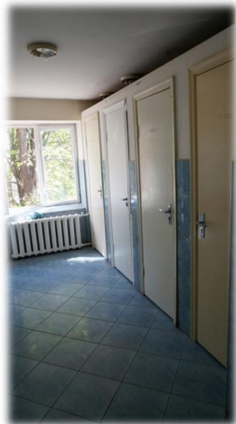
Rīga, Ieriķu iela 2B – koplietošanas labierīcības