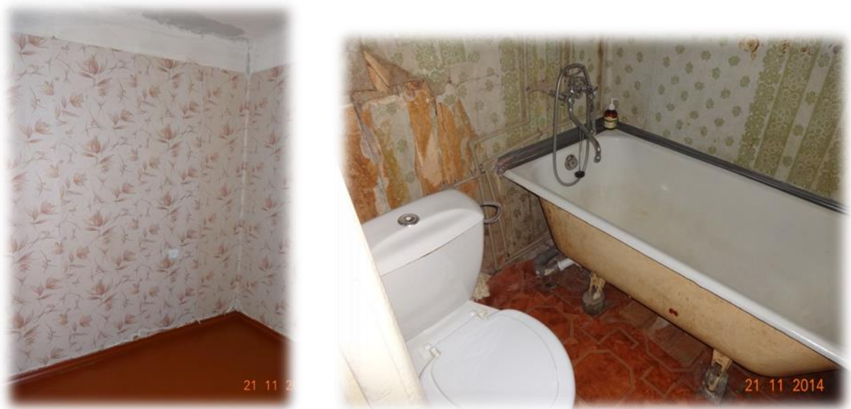
Daugavpils, Butļerova iela 4-50

Daugavpils, Butļerova ielas 4-50 dzīvoklis uz apskates brīdi aptuveni trīs mēnešus bija brīvs. Pa šo laiku dzīvoklī ir nomainīts grīdas segums. Pašvaldības pārstāvji uzsver, ka palīdzības reģistrā esošām personām tiek piedāvāti tikai dzīvošanai derīgi mājokļi. Vienlaikus kosmētiskā remonta veikšana paliek potenciālā īrnieka ziņā.