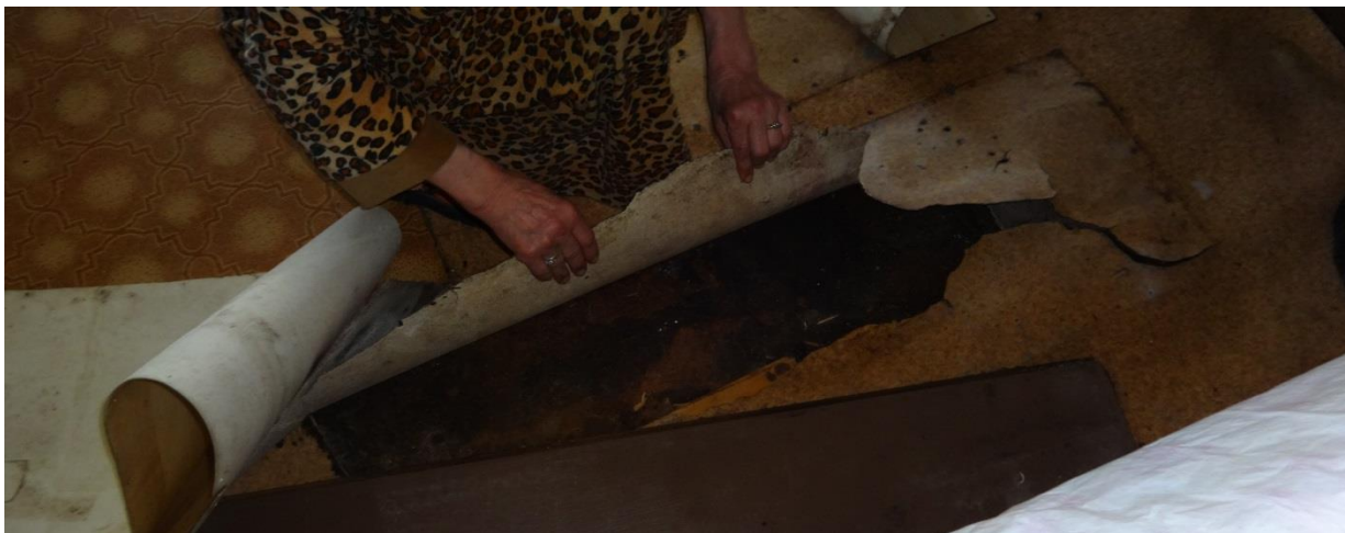
Prūšu iela 25A – koplietošanas telpas (virtuves) grīda

Apsekošanas laikā vairāki mājas iedzīvotāji uzrādīja koplietošanas telpu stāvokli, uzsverot, ka apsaimniekotājs tam nepievērš pietiekamu uzmanību, piemēram, izpuvusi grīda zem linoleja pārklājuma virtuves telpā, koplietošanas dušu telpu kritiskais stāvoklis, kurā netiek ievērots personas privātums, proti, nav aizklāti telpas logi.