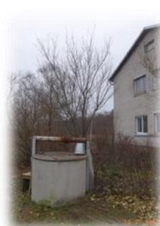
Grobiņa, Viršudruvas 2, Grobiņas pagasts – labierīcības un ūdens ieguves vieta