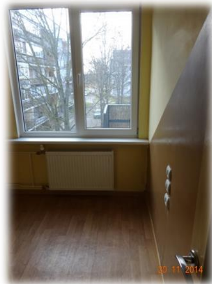
Salaspils, Miera iela 16/8-23