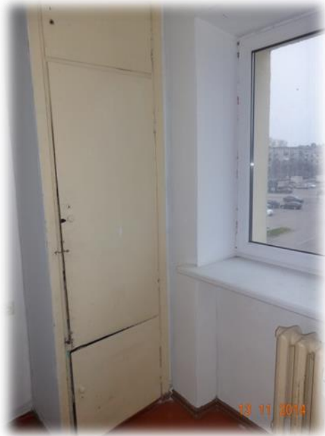
Jelgava, Raiņa iela 10-38