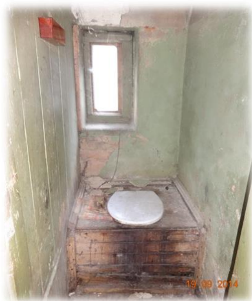
Rīga, Alauksta iela 17 - labierīcības

Rīgas, Valmieras ielas 24-18 brīvā dzīvojamā telpa vizuāli un sadzīviskā ziņā līdzinājās Rīgas, Mangaļsalas 7b namam. Tā ir dažādu sociālo grupu kopdzīvojamā māja. Par dzīvojamo telpu turpmāko lietošanu lems pašvaldība. Atsevišķi dzīvokļi ēkā ir privatizēti. Koplietošanas telpas ir antisemitārā stāvoklī. Kopumā dzīvojamās telpas atbilstība dzīvošanai derīgas telpas kritērijiem ir apšaubāma, jo šādos apstākļos nevar izpildīties nosacījums par telpas piemērotību ilglaicīgam patvērumam.