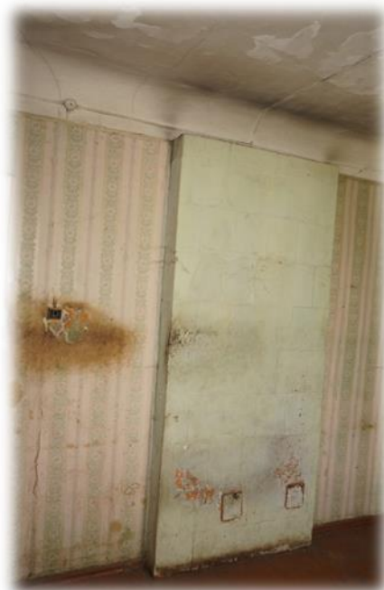
Sigulda, Rožu iela 18-7

Siguldas novadā, Plānupē, Augšupes 1, Allažu pagastā brīvās dzīvojamās telpas atrodas viestāvu koka mājā, kura daļēji ir apdzīvota. Pašvaldībai mājā pieder trīs dzīvokļi.