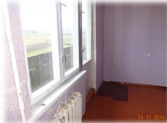
Ventspils novads, Rūpnīcas iela 2, 5 un 8