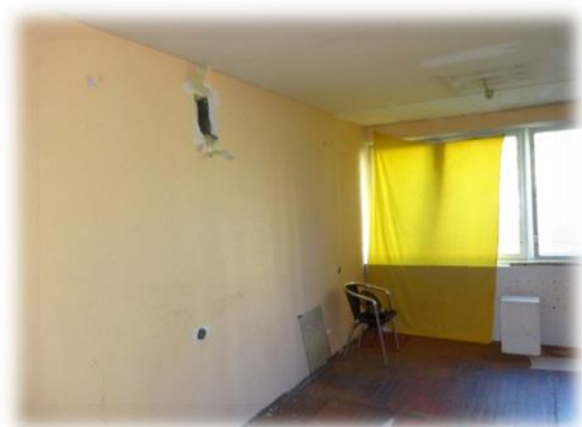
Rīga, Prūšu iela 25A – brīva dzīvojamā telpa

Jāatzīmē, ka Rīgas pašvaldībā tika apskatītas arī dzīvojamās telpas, kuras šobrīd vairs netiek piedāvātas pašvaldības palīdzības reģistrā esošajām personām. Atsevišķu dzīvojamo telpu monitorings tika veikts, pamatojoties uz personu saņemto informāciju par dzīvošanai nepiemērotiem apstākļiem, piemēram, par kopdzīvojamo māju ar daļējām ērtībām Rīgā, Prūšu ielā 25a . Šajā piecu stāvu namā atrodas 200 istabas, taču uz 22.05.2014. 2 36 no tām bija brīvas, bet vēl par 27 istabu īrnieku parādiem notika tiesvedība.