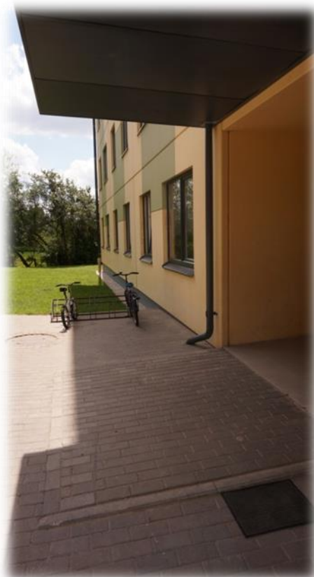
Cēsis, Caunas iela 7a