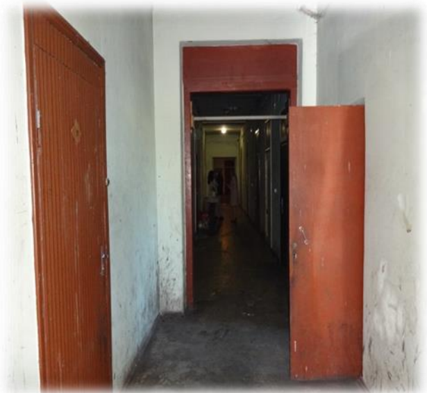
Rīga, Mangaļsalas iela 7B - gaitenis

Uzmanība pievēršama faktam, ka jau 14 gadus šī nama dzīvoklī Nr.5 dzīvo ģimene ar diviem nepilngadīgiem bērniem. Ģimene dzīvo vienā telpā, kas ar lupatām un preskartonu sadalīta nišās, kur izvietotas gultas. Turpat iekšā ir iebūvēta plīts. Pēc ģimenes stāstītā, viņas bērni vakaros no telpām ārā neizejot, jo baidoties par savu drošību un dzīvību. Dzīvojamā telpa ģimenei ierādīta 2000.gadā, kad no iepriekšējām telpām tā izlikta par parādiem. Persona esot vērsusies Rīgas pašvaldībā, uz ko saņēmusi atbildi, ka viņai nav vērts reģistrēties dzīvokļu rindā, jo ģimenei pienāksoties vien vienistabas dzīvoklis. Tiesībsarga biroja pārstāvji dzīvokļa ģimenei ieteica atkārtoti ar rakstisku iesniegumu vērsties Rīgas domes Mājokļu un vides departamentā, lai tiktu izskatīts jautājums par ģimenes uzņemšanu dzīvokļu rindā.