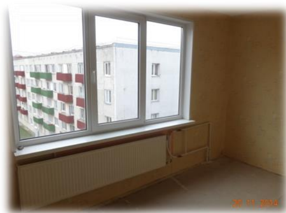
Aizkraukle, Jaunceltnes iela 39-51

Aizkraukles, Jaunceltnes ielas 39-51 dzīvoklis uz apsekošanas brīdi bija brīvs pāris nedēļas.