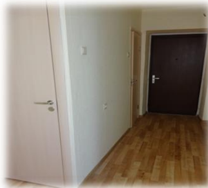
Jūrmala, Skolas iela 63-24

Jūrmalas, Skolas ielas 44-128 dzīvoklis ir pēc tikko veikta kapitālā remonta. Visa māja aptuveni gadu atpakaļ renovēta un nodota ekspluatācijā. Dzīvoklis aprīkots pat ar ledusskapi un iebūvētu virtuves iekārtu – šāda privilēģija potenciālajam īrniekam no pašvaldības puses nebija vērojama nevienā