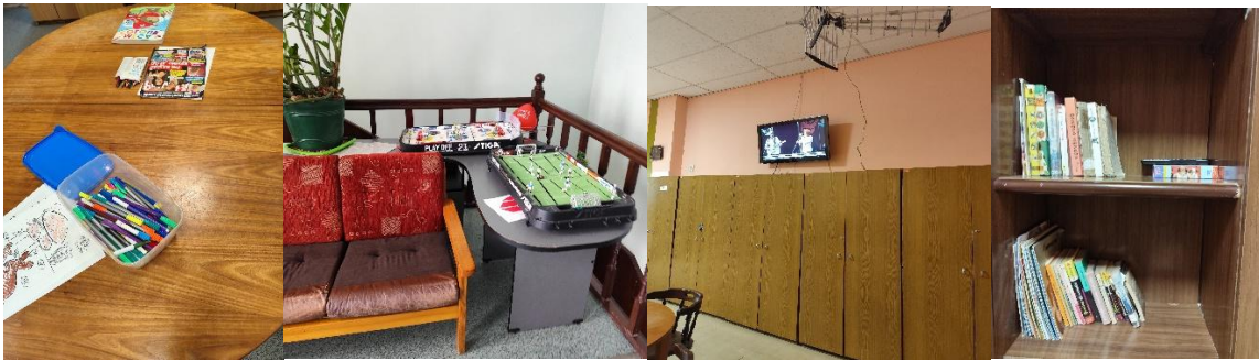
(Brīvā laika pavadīšanas iespējas 24.02.2026.)

koplietošanas telpās izvietoti salīdzinoši augstu un attālināti no skatītājiem, kas var apgrūtināt to lietošanu. Tostarp iemītņieki norādīja arī uz skaņas un attēla kvalitātes regulāru problemātiku. Vairums iemītņieku uzturējās savās istabās, atsevišķiem iemītņiekiem istabās bija pieejami radio un televizori, vienam iemītņiekam bija dators. No gaitenī izvietotās informācijas secināms, ka februāra mēnesī bija organizētas šādas rehabilitācijas nodarbības: 03.02. un 25.02. - radošā nodarbība; 05.02.; 11.02.; 19.02.; 26.02. – kulinārijas nodarbība; 11.02.un 24.02. - galda spēles; 12.02. – Valentīndienas pasākums.