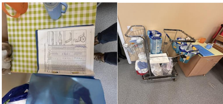
(Pozicionēšanas un dzirdīšanas žurnāls, aprūpes stacija, aplūkota 24.02.2026.)

[5.9] Sarunas laikā ar SAC "Vecpiebalga" direktori saņemta informācija, ka institūcijā guļošu iemītnieku nav, tomēr apskates laikā tika konstatēti divi guļoši iemītnieki. Abiem iemītniekiem bija pretizgulējuma matracis, atsevišķa aprūpes stacija, izgulējuma monitoringa žurnāls, pozicionēšanas un dzirdīšanas žurnāls.