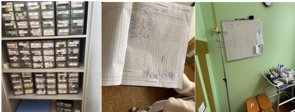
(Medikamentu kastītes, individuālās kartes 24.02.2026.)

[5.6] Pozitīvi vērtējams vizītes laikā novērotais, ka katram iemītniekam ir individuāla medicīniskā kastīte, kas būtiski samazina medikamentu sajaukšanas risku, kā arī individuālā medikamentu izsniegšanas karte. Tostarp institūcijā ir arī atsevišķs akūto medikamentu skapītis, kurā tiek glabāti biežāk lietotie medikamenti, piemēram, paracetamols, ibumetīns, loperamīds u.c. SAC "Vecpiebalga" ir reģistrēts ārstniecības iestādes punkts, kurā tiek veikta iemītnieku medicīniskā aprūpe, tostarp, brūču pārsiešana.