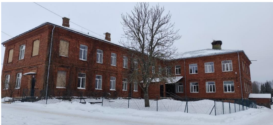
(SAC Vecpiebalga 24.02.2026.)