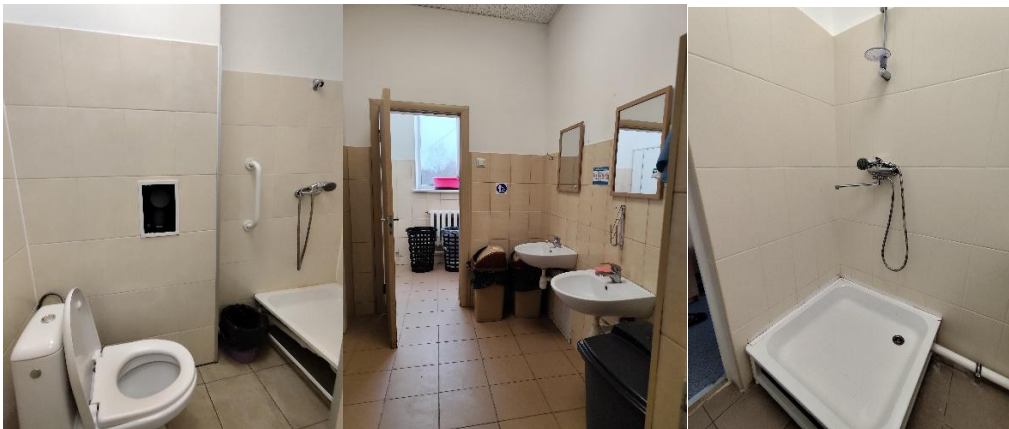
(Tualetes un dušas telpas 24.02.2026.)

[2.5] Atsevišķās istabās ir pieejama tualete. Savukārt pārējie iemītnieki izmanto katrā stāvā pieejamo kopīgo tualeti un dušas telpas. Vizītes dienā telpas bija tīras, tomēr ne visur bija pieejams tualetes papīrs (vairākiem iemītniekiem tas bija novietots istabiņās uz individuālajiem skapīšiem). Vairākas tualetes nav piemērotas personām ratiņkrēslos.