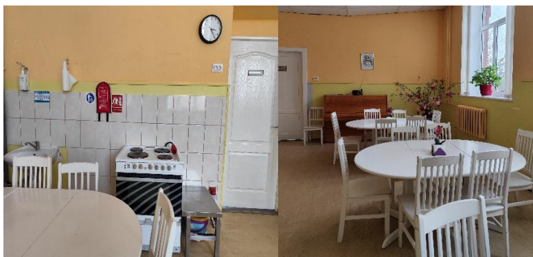
(Ēdamtelpa pirmajā stāvā 24.02.2026.)

Atsevišķi iemītnieki izteica sūdzības par rīta putru, kura nav garšojusi. Darbinieki norādīja, ka uz sūdzībām tiek reaģēts un nepieciešamības gadījumā ir bijušas pārrunas ar ārpakalpojuma sniedzēju.